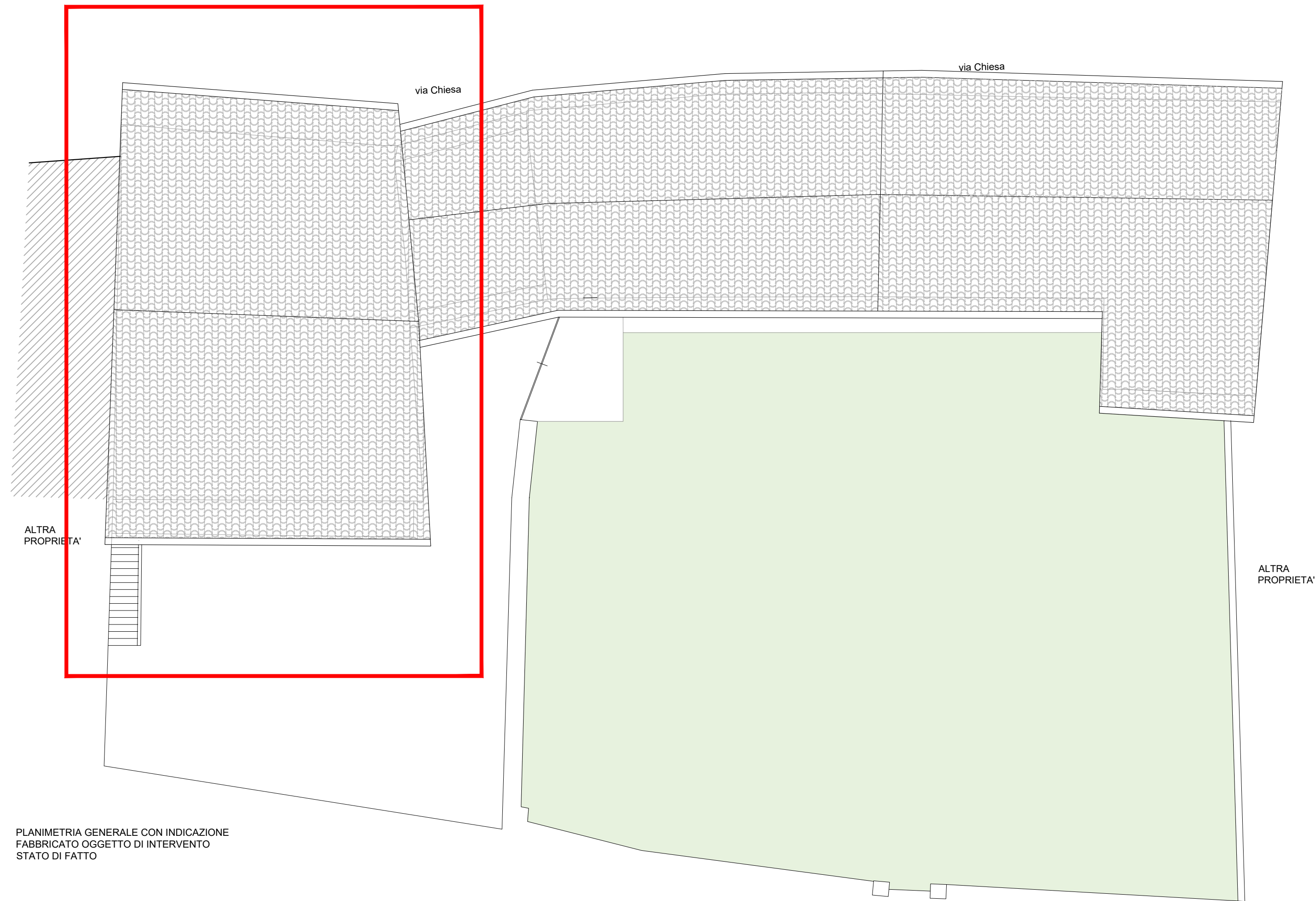
PLANIMETRIA GENERALE CON INDICAZIONE FABBRICATO OGGETTO DI INTERVENTO STATO DI FATTO